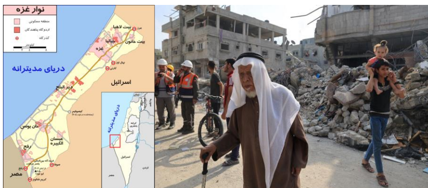
۸ اکتبر ۲۰۲۳، جنوب نوار غزا، پس از یک حمله هوایی اسرائیل

آیا این حمله خونین، ارتباطی به حمله حماس به اسرائیل دارد یا نه؟ روشن نیست!