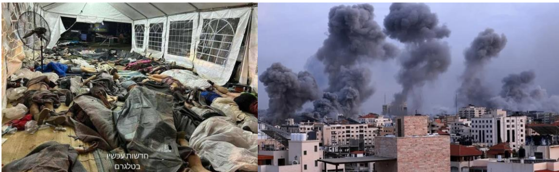
بمباران غزه توسط نیروی هوایی اسرائیل و کشتار غیرنظامیان در اسرائیل توسط حماس

واشنگتن که هر سال ۳/۸ میلیارد دلار کمک نظامی به اسرائیل ارائه می‌کند هم‌چنین اعلام کرد که به زودی تجهیزات جدید دفاع هوایی، مهمات و سایر کمک‌های امنیتی را به این کشور خواهد فرستاد.