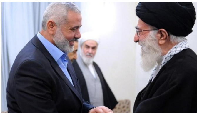
اسماعیل هنیه و علی خامنه‌ای

این اظهارات در حالی مطرح شد که عربستان ظرف یک هفته میزبان دومین وزیر اسرائیل بود و آمریکا به دنبال عادی‌سازی روابط ریاض و تل‌آویو است.