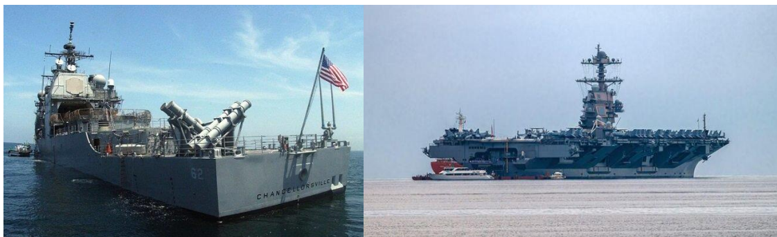
آمریکا می‌گوید ناو هواپیمابر «یواس اس جرالدر آر فورد» را به اسرائیل نزدیک‌تر می‌کند

اسرائیل هم‌چنین مقر شرکت خصوصی مخابرات فلسطین را بمباران کرد که می‌تواند بر خدمات تلفن ثابت، اینترنت و تلفن همراه تاثیر بگذارد. سازمان ملل می‌گوید در نتیجه جنگ بین ارتش اسرائیل و حماس تعداد آواره‌های غزه به بیش از ۱۲۳۰۰۰ نفر رسیده است. به گفته دفتر هماهنگی امور بشردوستانه سازمان ملل متحد، تا اواخر روز یکشنبه، حملات هوایی تلافی‌جویانه اسرائیل ۱۵۹ واحد مسکونی را در سراسر غزه ویران کرده و به ۱۲۱۰ واحد دیگر آسیب جدی وارد کرده است. آژانس پناهندگان فلسطینی سازمان ملل اعلام کرد که مدرسه‌ای با بیش از ۲۲۵ نفر مورد حمله مستقیم قرار گرفت. چندین خبرنگاری اسرائیلی به نقل از مقامات خدمات امدادی اعلام کردند که حداقل ۷۰۰ نفر از جمله ۴۴ سرباز در اسرائیل کشته شده‌اند. وزارت بهداشت غزه اعلام کرده است ۴۱۳ نفر از جمله ۷۸ کودک و ۴۱ زن در این منطقه کشته شدند. حدود ۲۰۰۰ نفر از هر طرف زخمی شده‌اند.