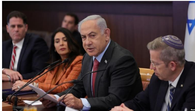
نشست کابینه اسرائیل

مصوبه امروز به دولت امکان می‌دهد تمامی نهادها و وزارتخانه‌ها و سایر امکانات کشور را در اختیار تحقق اهداف جنگ بگذارد. آویگدور لیبرمن، سیاست‌مدار مخالف دولت نتانیاہو، روز شنبه گفته بود که اعلام رسمی وضعیت جنگی برای پیش برد اهداف جنگ اهمیت اساسی دارد.