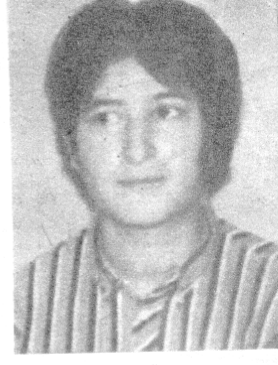
اعظم روحی آهنگران

نیروی هوایی دوران سربازی خود را می گذراند. به دنبال مخفی شدن نزهت ، بهمن نیز با ترک خدمت سربازی اش زندگی مخفی را آغاز می نماید. رفیق اعظم نیز به آن دو می پیوندد. نزهت در سازمان