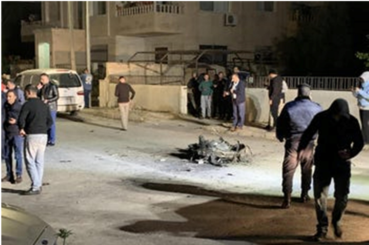
بقایای یک موشک ایرانی که روز یکشنبه در خیابان های اردن سقوط کرد.

حالا که اهمیت یک ائتلاف بین المللی که شامل کشورهای عربی میانه رو است، در آخر هفته (به وقت حمله ایران) به وضوح نشان داده شد، اسرائیل باید تلاش خود را برای بازگرداندن روابط با اردن تشدید کند. این امر نمیبایست به روابط یا همکاری های اطلاعاتی محدود شود زیرا امنیت و ثبات سیاسی اردن ارتباط نزدیکی با تحولات غزه و کرانه باختری دارد. اما (ظاهراً) اردن کسی را در اسرائیل برای درک این ضرورت و پرداختن به این مسائل ندارد.