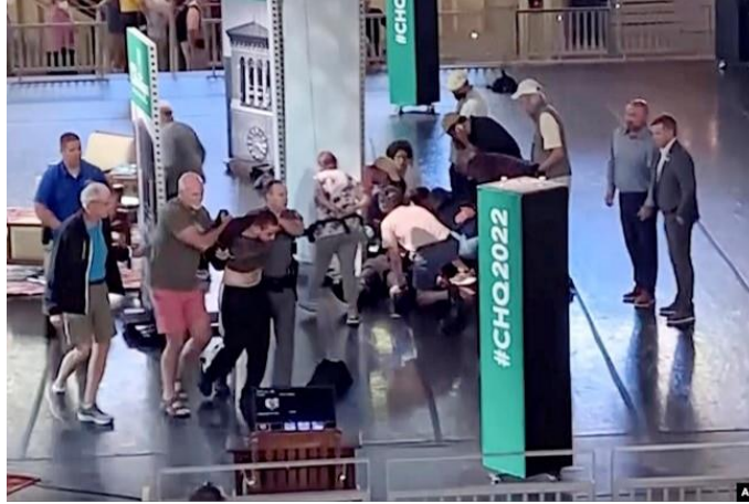
تصویری از صحنه حمله به سلمان رشدی