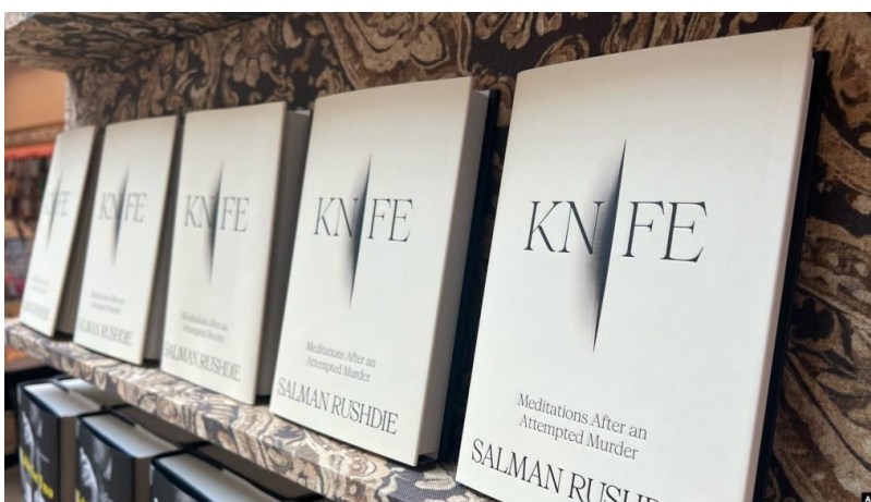
طرح جلد کتاب «چاقو؛ تاملاتی پس از یک تلاش برای قتل»

کتاب جدید سلمان رشدی نویسنده هندی-بریتانیایی درباره سوءقصدی که کم‌تر از دو سال پیش به جانش شد، با عنوان «چاقو؛ تاملاتی پس از یک تلاش برای قتل» روز سه‌شنبه ۱۶ آوریل ۲۰۲۴ - ۲۸ فروردین ۱۴۰۱ منتشر شد. سلمان رشدی چند سالی است که ساکن آمریکا شده است. کتاب جدید سلمان رشدی واقعه حمله به خودش در یک روز تابستانی در سالی مملو از جمعیت در حومه نیویورک را روایت می‌کند که در جریان آن شدیداً آسیب دید و چشم راست خود را از دست داد. رشدی که اکنون هفتاد و شش ساله است، در بخشی از این کتاب نوشته است: «آخرین چیزی که چشم راستم برای همیشه دید: مرد سیاه‌پویشی بود که در سمت راست جایی که نشسته بودم به سمت من می‌دوید. لباس مشکی، ماسک صورت مشکی. مثل یک موشک خمیده سخت و کند حرکت می‌کرد. اعتراف می‌کنم، گاهی قاتلم را تصور می‌کردم که در برخی از نشست‌های عمومی یا جاهای دیگر بلند می‌شود و دقیقاً به همین شکل به سراغم می‌آید. بنابراین وقتی دیدم قاتلم به این شیوه به سمت من هجوم می‌آورد به اولین چیزی که فکر کردم این بود: «پس تو هستی. بفرما.»