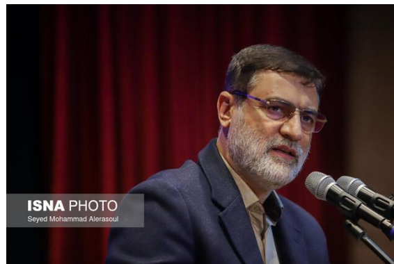
امیرحسین قاضی‌زاده هاشمی

اساساً تفاوت چندین بین جناح اصلاح‌طلبان و اصول‌گرایان وجود ندارد. هر موقع حاکمیت به خطر افتاده هر دو جناح متحد شده‌اند تا مخالفان را به شدیدتری شکلی سرکوب کنند. رقابت آن‌ها نه بر سر مطالبات مردم، بلکه بر سر تقسیم قدرت و ثروت در حاکمیت است. به خصوص هر دو جناح در جنایت‌های بی‌شمار دهه شصت سهیم‌اند و مرتکب جنایت علیه بشریت شده‌اند.