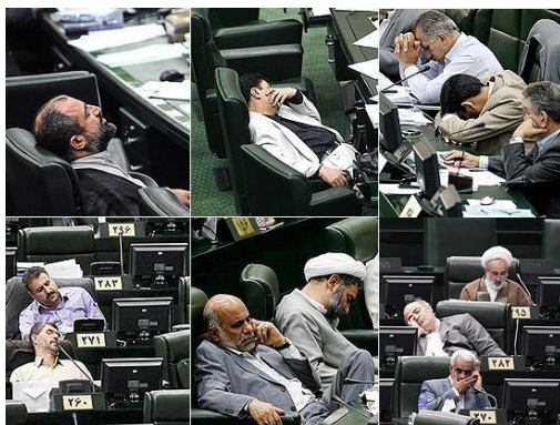
نمایی از مجلس شورای اسلامی ایران

چهاردهمین انتخابات ریاست جمهوری ایران برای انتخاب نهمین رئیس‌جمهور ایران جمعه ۸ تیر ۱۴۰۳ برگزار خواهد شد.