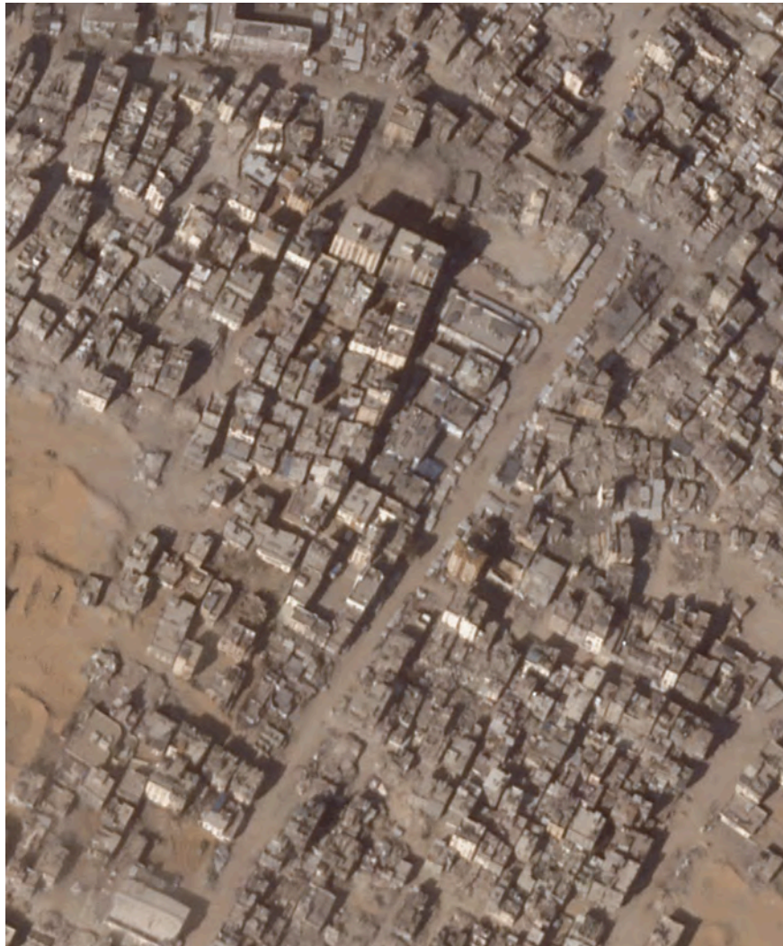
ویرانی در شرق جبالییا در ماه اکتبر. ارتش اسرائیل گاه به مناطق هنوز پرجمعیت شلیک می کند

خاک یکسان می کند. یک افسر عالیرتبه که در جنگ حضور دارد، توضیح می دهد: «ما صبح که از خواب بیدار می شویم یک بولدوزر زرهی D9 روشن نمی کنیم تا محله ها را ویران کنیم. اما اگر نیاز به پیشروی در مناطق خاصی داشته باشیم، نیروهای خود را در معرض تله های انفجاری و مواد منفجره قرار نخواهیم داد.»