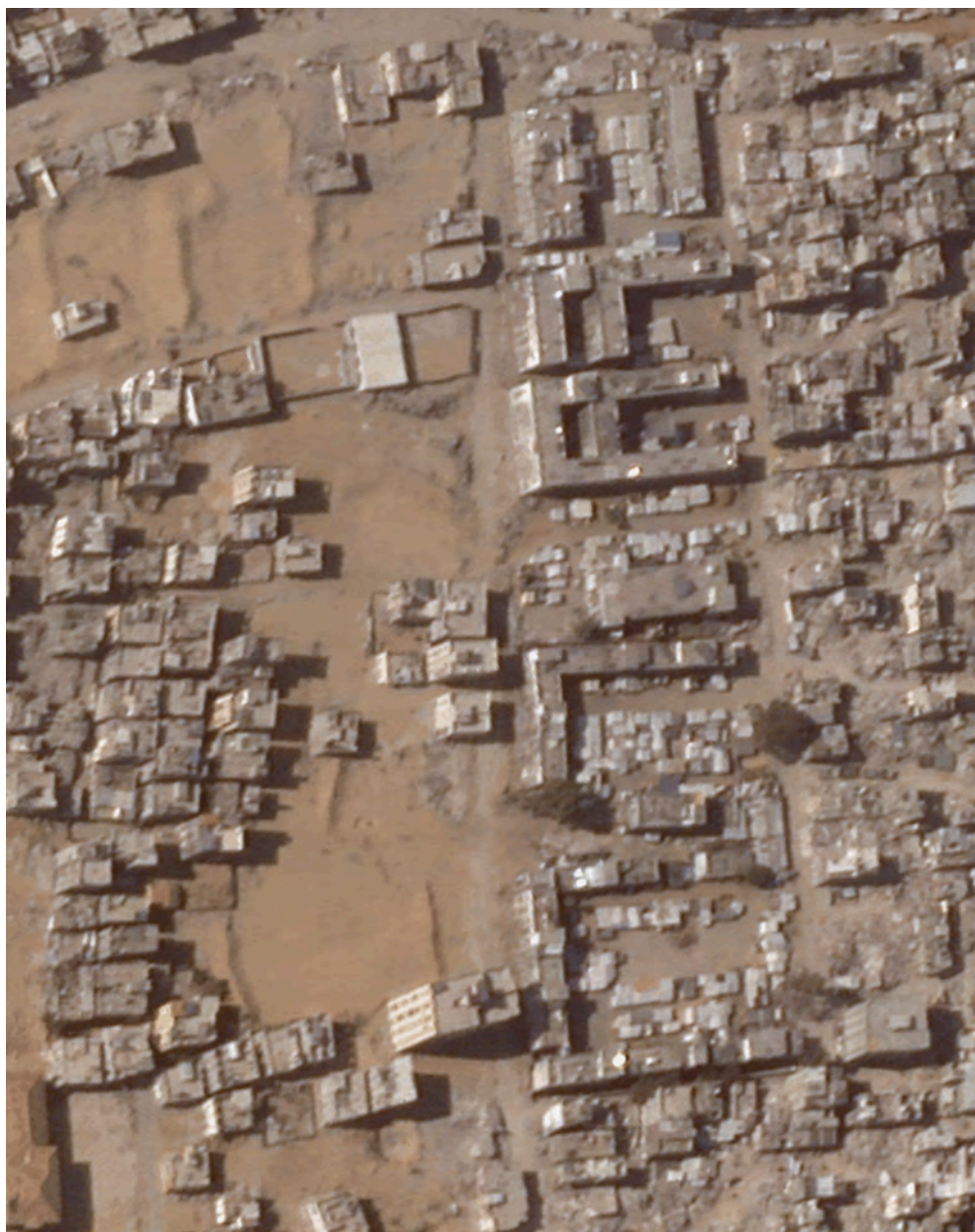
جبالیا در ماه اکتبر شاهد تخریبهای مداوم بوده و به نوعی منطقه محاصره نظامی شبیه شده است

اما منابع ارشد دفاعی که با هآرتص صحبت کرده اند، بطور سر بسته تأیید می کنند که آنچه به جامعه اسرائیل ارائه می شود، لزوماً آن چیزی نیست که واقعاً اتفاق می افتد. آنها می گویند ارتش اسرائیل در حال حاضر موظف است روستاها و شهرها را از ساکنان آنها خالی کند. به عنوان مثال، تنها حدود 20000 نفر در منطقه ای باقی مانده اند که قبل از جنگ بیش از 500000 نفر از ساکنان غزه را در خود جای داده است.