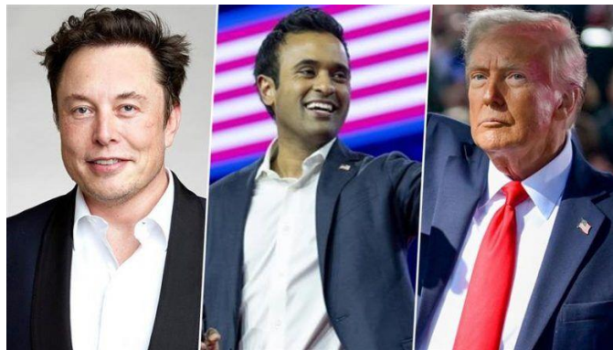
«ترامپ»، «ایلان ماسک»، مالک شبکه اجتماعی «ایکس» و «ویوک راماسوامی»

دونالد ترامپ، هم‌چنین در حکم جداگانه‌ای جان رتکلیف را به‌عنوان رئیس سی‌آی‌ای در دولت آینده خود منصوب کرد، نماینده سابق کنگره ایالات متحده از تگزاس و مدیر اطلاعات ملی آمریکا در دولت اول ترامپ. حکم ترامپ نیز به سابقه جان رتکلیف در مقام مدیر اطلاعات ملی آمریکا اشاره می‌کند و از او به‌عنوان نخستین شخصیتی نام می‌برد که توانسته به ریاست هر دو سازمان عالی اطلاعاتی کشور برسد. جان رتکلیف در این حکم به‌عنوان «یک مبارز شجاع» توصیف شده که در راه «دفاع از حقوق اساسی همه آمریکایی‌ها» تلاش می‌کند و با قدرت از امنیت ملی و صلح در آمریکا محافظت خواهد کرد. متحدان رئیس‌جمهور منتخب رتکلیف را به‌عنوان وفاداری جدی به ترامپ می‌شناسند که احتمالاً می‌تواند تاییدیه سنا را به دست آورد. هم‌زمان با صدور این احکام، آقای ترامپ هم‌چنین به وعده خود برای استفاده از ایلان ماسک در دولت آینده عمل کرد و او را به همراه ویوک راماسوامی وزرای «کارآمدی دولت» نامید. پیش از این گفته می‌شد که دونالد ترامپ قصد دارد کمیسیونی تحت این نام تشکیل دهد، اما اکنون مشخص شده که وزارتخانه جدیدی به مجموعه دولت فدرال اضافه خواهد شد.