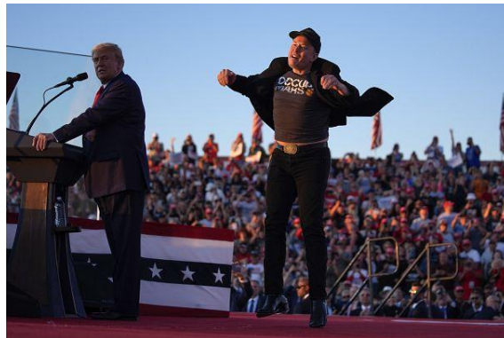
بالا و پایین پریدن‌های ایلان ماسک در یکی از سخنرانی‌های دونالد ترامپ بسیار مورد توجه رسانه‌ها قرار گرفته بود

کراستف معتقد است که سیاست در حال یادگیری زندگی با مشکلات است و سیاست هیچ پیروزی روشنی نمی‌شناسد، سیاست مدیریت هراس است نبردی با سرگیجه و پوچی.