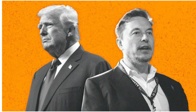
ایلان ماسک و دونالد ترامپ

ایلان ماسک، ثروتمندترین فرد جهان و بزرگ‌ترین نام در جهان فناوری است که از ترامپ حمایت کرد. حمایت ماسک، نقطه اوج هفته‌ها حمایت فزاینده دنیای فناوری از دونالد ترامپ بود. پیش از او سرمایه‌گذاران با نفوذ و برخی رهبران جهان فناوری، از جمله مارک اندرسون، حامی مالی سابق حزب دموکرات، و سرمایه‌گذاران بزرگ مارک آندرسن و بن هورویتز و دوقلوهای وینکلوس، بازیگران دنیای ارزهای دیجیتال، از ترامپ حمایت کردند.