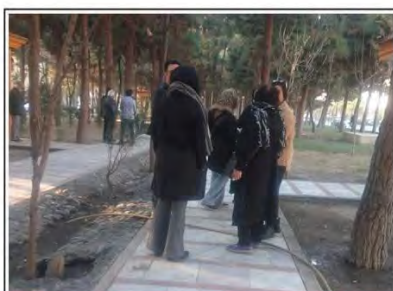
صف‌آرایی نیروهای سرکوبگر امنیتی و جلوگیری از برگزاری مراسم بزرگداشت محمد مختاری و محمدجعفر پوینده

کانون نویسندگان ایران، هر سال در سالگرد قتل‌های زنجیره‌ای، طی فراخوانی از برگزاری مراسم یادبود گورستان امامزاده طاهر مهرشهر کرج خبر می‌دهد اما ماموران امنیتی جمهوری اسلامی مانع برگزاری این مراسم‌ها می‌شود. ماموران امنیتی امسال نیز مانع برگزاری مراسم کانون نویسندگان ایران شد. کانون اعلام کرد: «روز جمعه ۱۶ آذر ماه امسال ماموران امنیتی نه فقط گورستان که خیابان‌های منتهی به آن و پارک مجاور گورستان را نیز محاصره کردند و راه‌های رسیدن مردم به مزار محمد مختاری و محمدجعفر پوینده را مسدود و از برگزاری مراسم آن دو ستم‌کشته‌ی سرفراز جلوگیری کردند.»