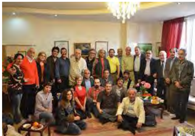
تصویری از اعضای کانون نویسندگان ایران

بازخوانی روند وقایعی که از پاییز سال ۷۷ آغاز شد و گردش اطلاعات در جامعه کمک کرد که پرده از جزئیات چندین واقعه مهم تاریخ سیاسی ایران در سال‌های ۷۷ تا ۷۹ نیز بردارد.